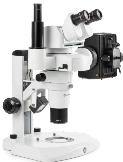
● Modelo de fluorescencia personalizado

Todos los modelos están equipados con oculares EWF10x / 22mm